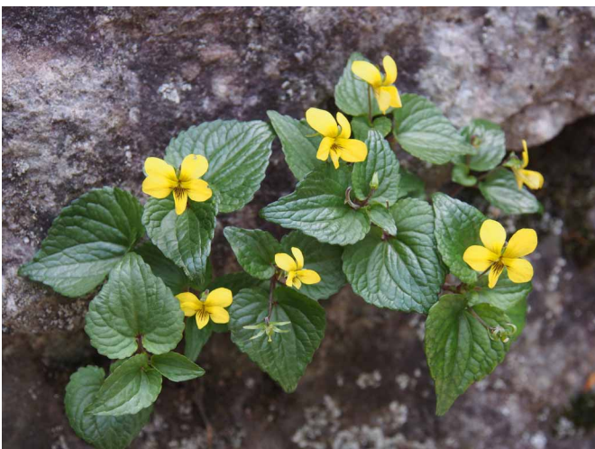
▲ダイセンキスミレ